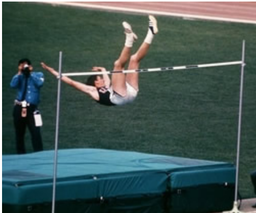
Richard Douglas Fosbury bei seinem Olympiasieg 1968