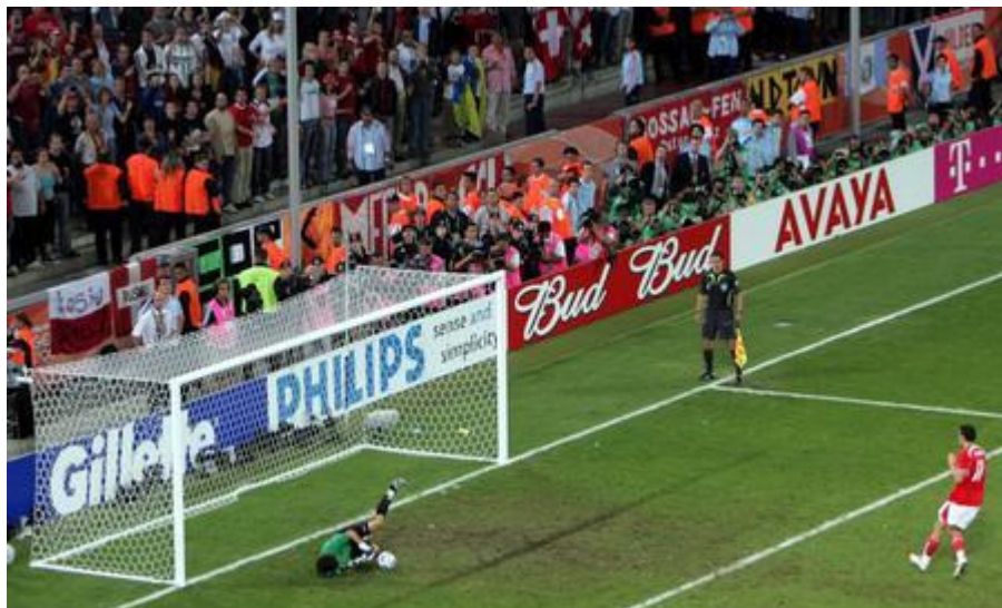
Streller war zu nervös